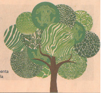
No profit. Il logo di Treadm, che documenta e posta sul profilo dell'utente la crescita di ciascun albero