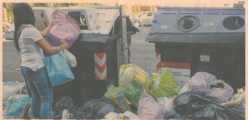
Emergenza. A Roma è ancora scontro tra Regione e Comune sulla gestione dei rifiuti

«Gli impianti - dice il Rapporto - rimangono la destinazione principale, salita dal 63,6% nel 2017 al 68,1% nel 2018. Grandi multiutility e Piccole e medie monoutility restano i maggiori investitori, con un dato aggregato sceso però dal 92,6% all'84,8%. Calano, invece, sia le quote di attrezzature (dal 16,7% nel 2017 al 15,1% nel 2018) che quelle di automezzi (dal 19,6% al 16,9%). In media, le aziende hanno investito il 4,6% del valore della produzione, con 14,2 euro per abitante. In entrambi i parametri, le Grandi multiutility hanno i valori più alti (7,6% del valore della produzione e 23,5 euro per abitante)».